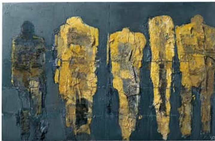
宮崎 進《楯》1988年 ミクストメディア・板 140.5×225.0(cm) 南南市美術館蔵

米子市立山陰歴史館、米子市立図書館、米子市文化ホール、米子市公会堂、 米子市淀江文化センター、米子市児童文化センター、米子市観光案内所(JR米子駅構内)、 米子高島屋、アルテプラザ(米子天満屋4階)、本の学校今井ブックセンター、今井書店駅前店、 今井書店境港店、鳥取県立博物館、倉吉博物館、安来市観光交流プラザ、 鳥取県立美術館ミュージアムショップ