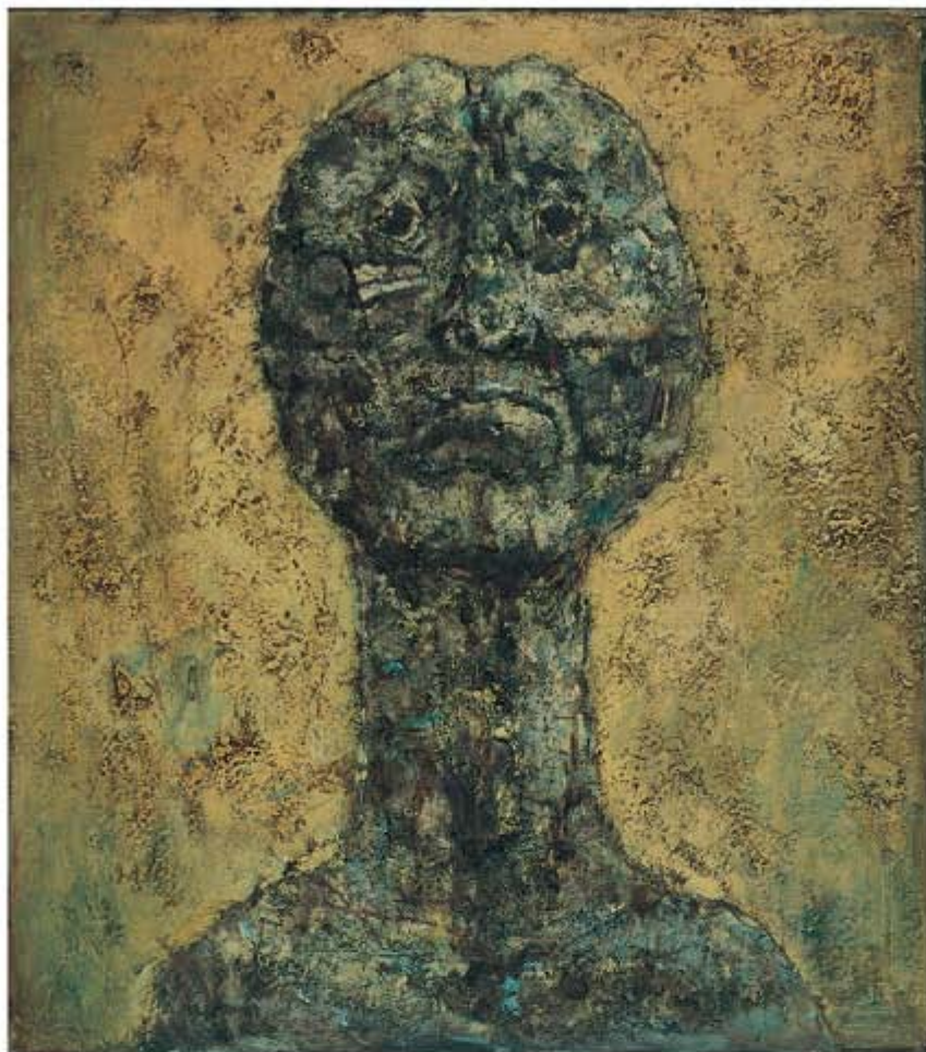
國頭 繁次郎《石の顔》1962年 油彩・板 80.4×91.3(cm) 個人蔵

ぼくの吠え叫ぶ声が 自分の声でなくなるまで ぼくは吠え続けた そうしてぼくは苦悩から救われる